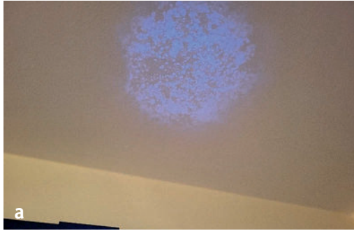
Abb. 3 | Souterrainwohnung

werden. Die Sporen der Schimmelpilze waren im Erdgeschoss in deutlich erhöhter Konzentration zu messen.