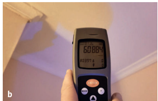
Abb. 2 | Schlafzimmer Ferienhaus

grund von Oberflächenveränderungen, welche weiter analytisch bestimmt werden muss. Anorganische Materialien, wie Gips, Kalk, Zement etc. (Wandverputze) fluoreszieren nicht und erscheinen in der optischen Forensik schwarz. Organische Materialien fluoreszieren hingegen [4]. Es wird vermutet, dass bei einem unpigmentierten Schimmelpilzbefall (daher nicht sichtbarem Schimmelpilzbefall) Metabolite fluoreszieren. Weiter weist das Chitin der Zellwand der Pilze, ähnlich der Zellulose bei pflanzlichen Zellen, eine schwache Eigenfluoreszenz auf. Es liegt der Schluss nahe, dass unpigmentierter Schimmelpilz in der Vergangenheit oft übersehen wurde und erst seit der Anwendung forensischer Lampen entdeckt wird. Mit der optischen Bauforensik ist es somit möglich, unsichtbare Schimmelpilzstellen schnell aufzufinden, selbst dann, wenn ein Schimmelschaden ohne fachgerechte Sanierung einfach überstrichen wurde [5].