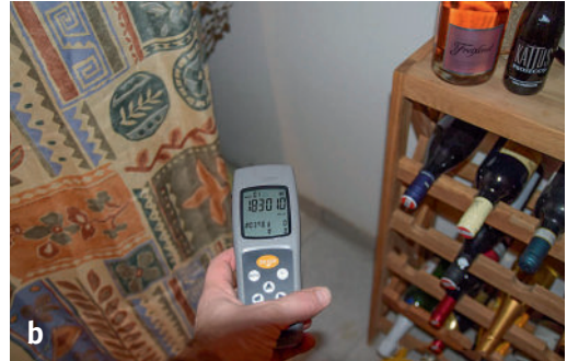
Abb. 1 | Kellerraum